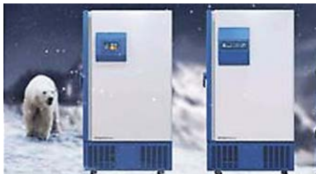
DUO-SAFE Premium DUO-SAFE Basic

Vågar du förvara värdefulla prover i en traditionell -86°C- frysfrys?